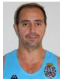
FERNANDO GRACIA LORCA